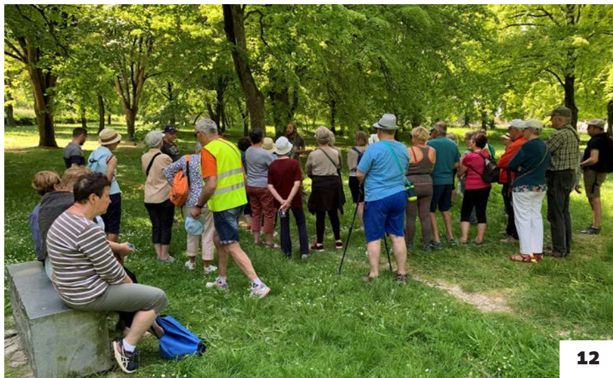
7. Rencontre de deux jours entre Éric Chenut, Président de la FNMF, et les mutuelles du Grand Est - Strasbourg/Nancy. 8. Concert Jazz de Cœur - Bouxières-aux-Dames. 9. Journées d'information et de repérage sensoriel à destination des usagers des Caisses primaires d'assurance maladie - Longwy/Nancy. 10. Atelier « Pour votre cœur, bougez plus ! » - Forbach. 11. Atelier « Ma santé au menu » - Lunéville. 12. Atelier « Des contes et des contrées » - Rethel.